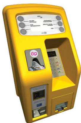
OVチップカード・チャージャー機

街中にあるキオスク、大手スーパーなどには、写真のようなカードチャージャー機があり、銀行のデビットカード、クレジットカード支払いでプリペイド金額をインプットさせることができます。駅の構内にある大型のチャージャー機は、現金を使うこともできます。OVチップカードの利